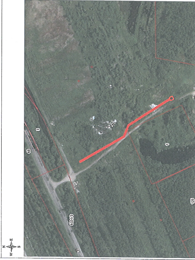
Масштаб 1:3500 Метод определения координат: метод спутниковых геодезических измерений Система координат МСК-29 (зона 2)